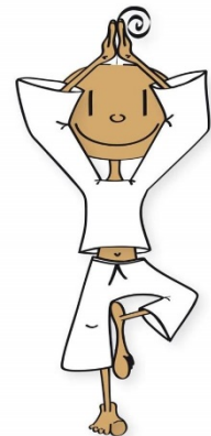
DER KLEINE YOGI